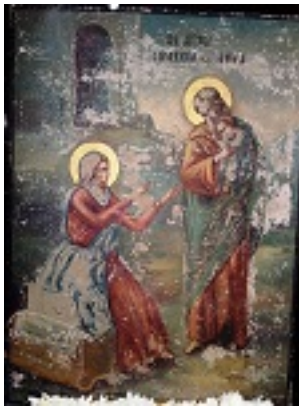
Μνήμη των Δικαίων Θεοπατόρων Ιωακείμ και Άννης - Ιερός Ναός του Ευαγγελισμού της Θεοτόκου Οξυλίνθου