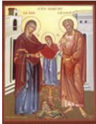
Μνήμη των Δικαίων Θεοπατόρων Ιωακείμ και Άννης