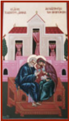
Μνήμη των Δικαίων Θεοπατόρων Ιωακείμ και Άννης - Λυδία Γουριώτη© ( http://lydiagourioti- iconography.blogspot.com )