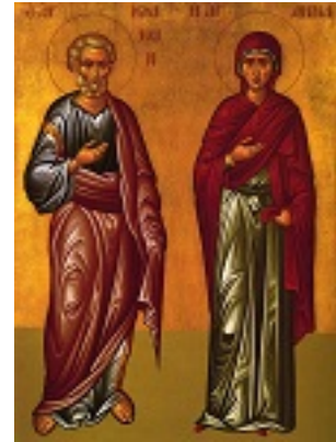
Μνήμη των Δικαίων Θεοπατόρων Ιωακείμ και Άννης