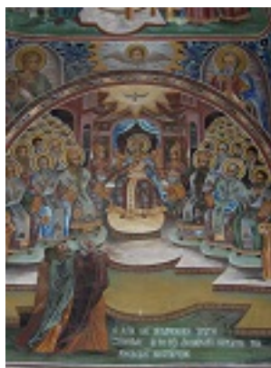
Γ' Οικουμενική Σύνοδος - Άγιον Όρος, Μείστη Λαύρα