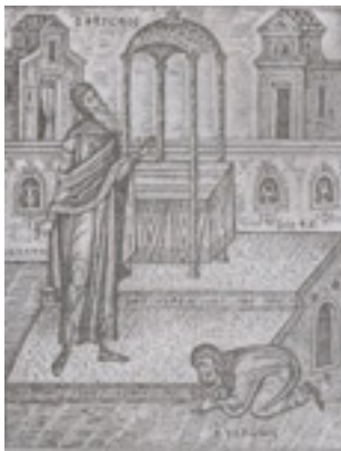
Τελώνου και Φαρισαίου (Αρχή Τριωδίου) - Φώτης Κόντογλου