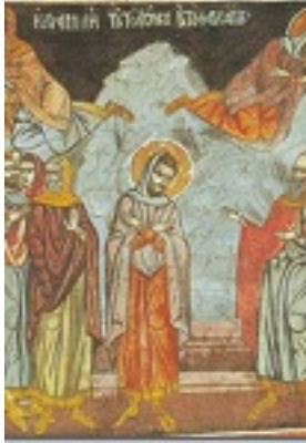
Τελώνου και Φαρισαίου (Αρχή Τριωδίου)