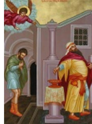
Τελώνου και Φαρισαίου (Αρχή Τριωδίου)