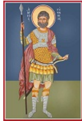
Άγιος Ευστάθιος - Καζακίδου Μαρία© (byzantineartkazakidou.blogspot.com)