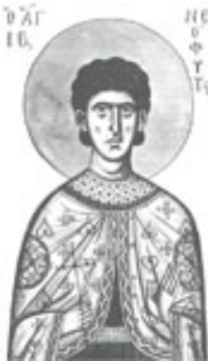
Άγιος Νεόφυτος ο Μάρτυρας