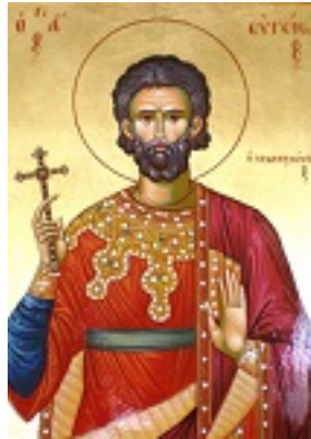
Άγιος Ευγένιος ο πολιούχος της Τραπεζούντας

(Ο άγιος Ευγένιος φέρει χρυσό φωτοστέφανο αντί βαθυκύανο) - γύρω στα 1375 μ.Χ. - Μονή Διονυσίου, Άγιον Όρος