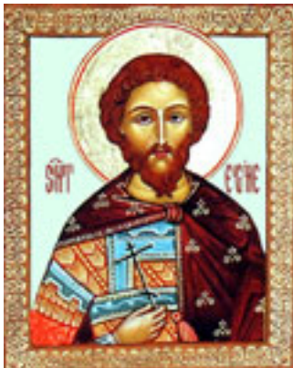
Άγιος Ευγένιος ο πολιούχος της Τραπεζούντας