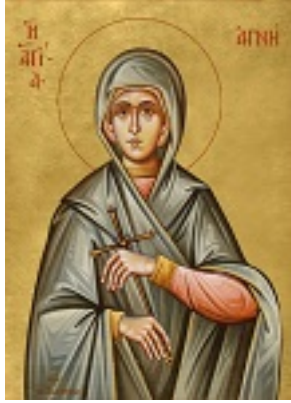
Αγία Αγνή - Δια χειρός Νικ. Γαλανόπουλου – www.karadokis.gr