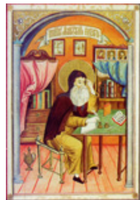
Άγιος Μάξιμος ο Γραικός