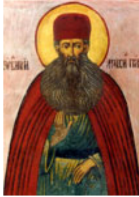
Άγιος Μάξιμος ο Γραικός