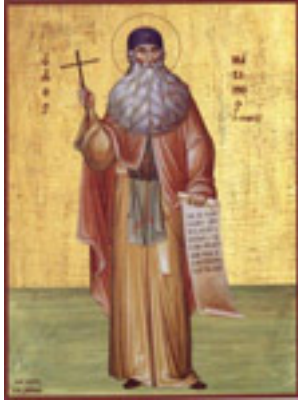
Άγιος Μάξιμος ο Γραικός