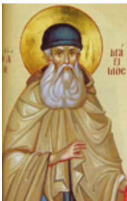
Άγιος Μάξιμος ο Γραικός