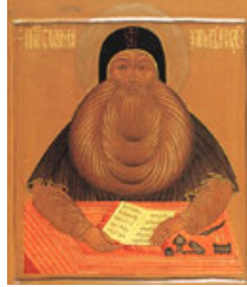
Άγιος Μάξιμος ο Γραικός