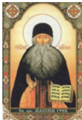
Άγιος Μάξιμος ο Γραικός