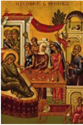
Γέννηση της Υπεραγίας Θεοτόκου