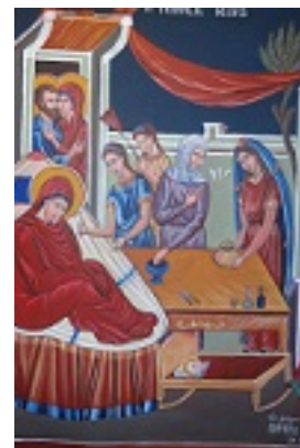
Γέννηση της Υπεραγίας Θεοτόκου - Πηνελόπη Σχιζοδήμου© (www.porpe.gr)