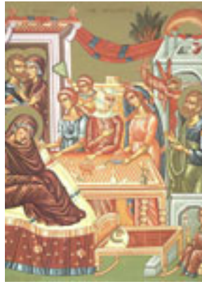
Γέννηση της Υπεραγίας Θεοτόκου