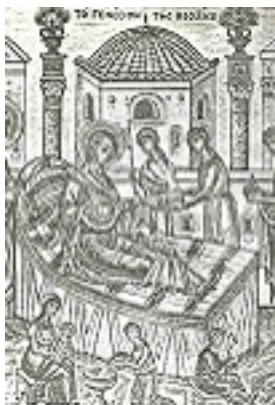
Γέννηση της Υπεραγίας Θεοτόκου - Φώτης Κόντογλου