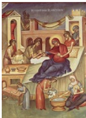
Γέννηση της Υπεραγίας Θεοτόκου