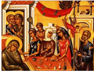
Ακούστε το απολυτίκιο!