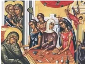
Ακούστε το απολυτίκιο!