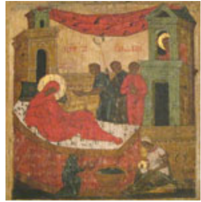
Γέννηση της Υπεραγίας Θεοτόκου