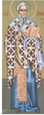
Άγιος Άνθιμος<br />Ιερομάρτυρας<br />επίσκοπος Νικομήδειας