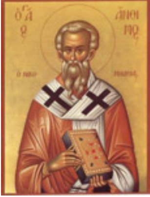
Άγιος Άνθιμος<br />Ιερομάρτυρας<br />επίσκοπος Νικομήδειας