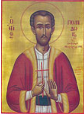
Άγιος Πολύδωρος ο Νεομάρτυρας από τη Λευκωσία