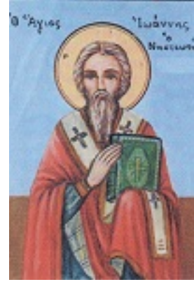
Άγιος Ιωάννης ο Νηστευτής, Πατριάρχης Κωνσταντινούπολης