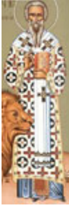
Άγιος Ιωάννης ο Νηστευτής, Πατριάρχης Κωνσταντινούπολης