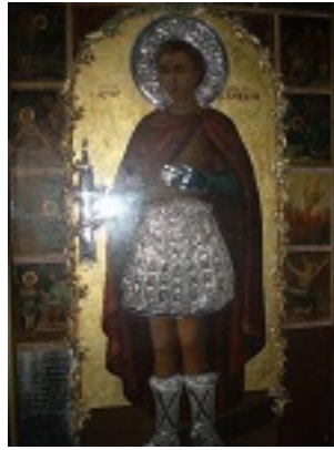
Άγιος Φανούριος ο Νεοφανής, ο Μεγαλομάρτυρας