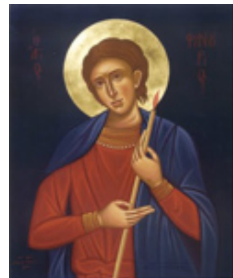
Άγιος Φανούριος ο Νεοφάνης, ο Μεγαλομάρτυρας