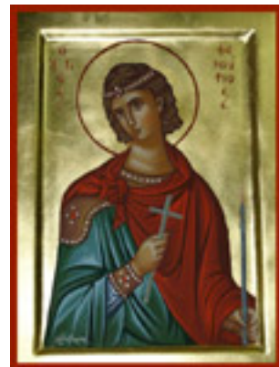
Άγιος Φανούριος ο Νεοφάνης, ο Μεγαλομάρτυρας - Λυδία Γουριώτη© (lydiagourioti- iconography.blogspot.com)