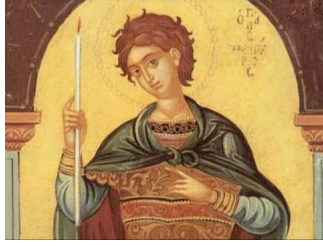
Ακούστε το απολυτίκιο!