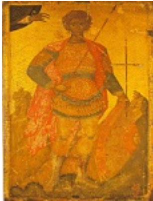
Άγιος Φανούριος ο Νεοφάνης, ο Μεγαλομάρτυρας