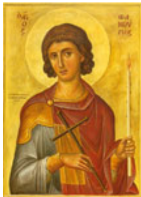
Άγιος Φανούριος ο Νεοφάνης, ο Μεγαλομάρτυρας