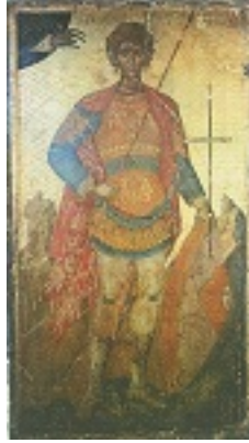
Άγιος Φανούριος ο Νεοφάνης, ο Μεγαλομάρτυρας