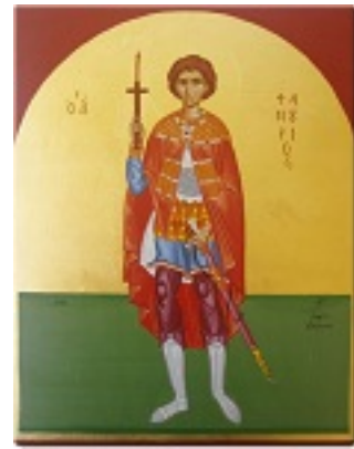
Άγιος Φανούριος ο Νεοφάνης, ο Μεγαλομάρτυρας - Γεωργία Δαμκούκα© (www.tempera.gr)