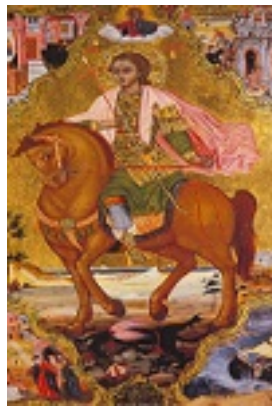
Άγιος Φανούριος ο Νεοφάνης, ο Μεγαλομάρτυρας