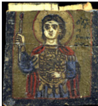
Άγιος Φανούριος ο Νεοφάνης, ο Μεγαλομάρτυρας