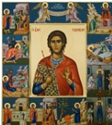
Άγιος Φανούριος ο Νεοφάνης, ο Μεγαλομάρτυρας