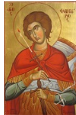
Άγιος Φανούριος ο Νεοφάνης, ο Μεγαλομάρτυρας - Μιχαήλ Χατζημιχαήλ