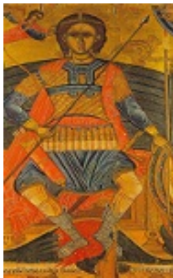
Άγιος Φανούριος ο Νεοφάνης, ο Μεγαλομάρτυρας