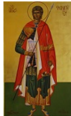
Άγιος Φανούριος ο Νεοφάνης, ο Μεγαλομάρτυρας - Μιχαήλ Χατζημιχαήλ© www.michaelhadjimichael.com