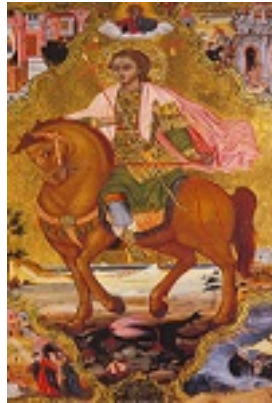
Άγιος Φανούριος ο Νεοφάνης, ο Μεγαλομάρτυρας