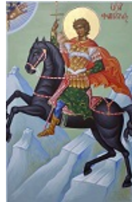
Άγιος Φανούριος ο Νεοφανής, ο Μεγαλομάρτυρας - Μιχαήλ Χατζημιχαήλ© www.michaelhadjimichael.com