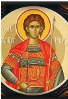
Άγιος Φανούριος ο Νεοφάνης, ο Μεγαλομάρτυρας