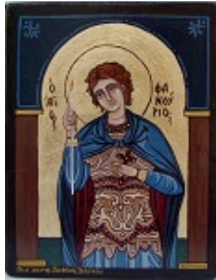
Άγιος Φανούριος ο Νεοφάνης, ο Μεγαλομάρτυρας - Σοφία Βλάχου© (taergamou.blogspot.com)