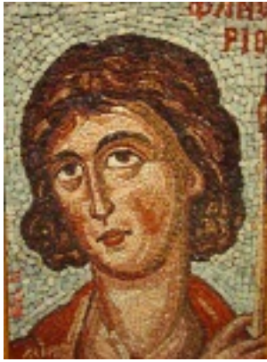
Άγιος Φανούριος ο Νεοφανής, ο Μεγαλομάρτυρας - Αγγελική Τσέλιου©