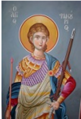
Άγιος Φανούριος ο Νεοφάνης, ο Μεγαλομάρτυρας