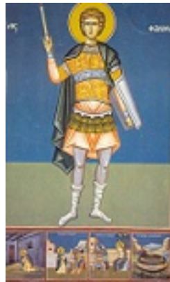
Άγιος Φανούριος ο Νεοφάνης, ο Μεγαλομάρτυρας