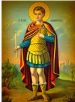
Άγιος Φανούριος ο Νεοφάνης, ο Μεγαλομάρτυρας