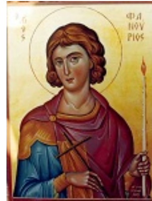
Άγιος Φανούριος ο Νεοφάνης, ο Μεγαλομάρτυρας - Αγγελική Τσέλιου©