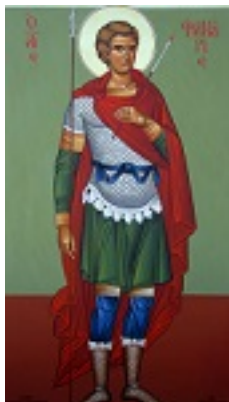
Άγιος Φανούριος ο Νεοφάνης, ο Μεγαλομάρτυρας - Μιχαήλ Χατζημιχαήλ