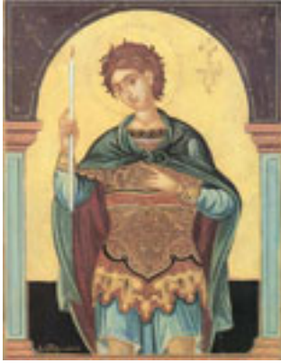
Άγιος Φανούριος ο Νεοφάνης, ο Μεγαλομάρτυρας