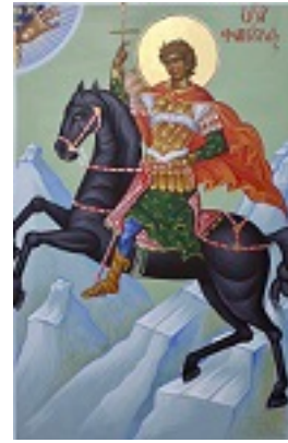
Άγιος Φανούριος ο Νεοφανής, ο Μεγαλομάρτυρας - Μιχαήλ Χατζημιχαήλ