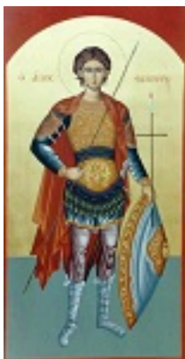
Άγιος Φανούριος ο Νεοφάνης, ο Μεγαλομάρτυρας