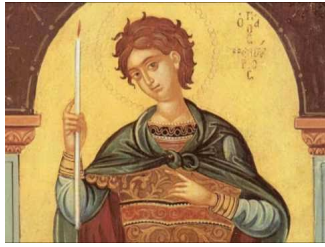
Ακούστε το απολυτίκιο!