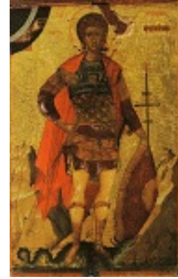
Άγιος Φανούριος ο Νεοφάνης, ο Μεγαλομάρτυρας - Χειρ Αγγέλου (Άγγελος Ακοτάντος) 15ος αιώνας μ.Χ.