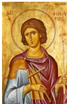
Άγιος Φανούριος ο Νεοφάνης, ο Μεγαλομάρτυρας - Κωνσταντίνος Τσιρακίδης© (diaxeiroskt.blogspot.com)