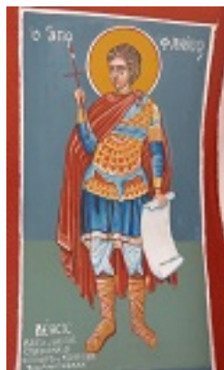
Άγιος Φανούριος ο Νεοφάνης, ο Μεγαλομάρτυρας - Πηνελόπη Σχιζοδήμου© (www.porpe.gr)