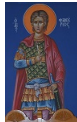
Άγιος Φανούριος ο Νεοφάνης, ο Μεγαλομάρτυρας - Νάουσα, Πάρος