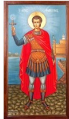
Άγιος Φανούριος ο Νεοφάνης, ο Μεγαλομάρτυρας