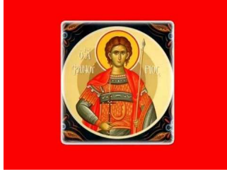
ΠΑΡΑΚΛΗΣΗ ΑΓΙΟΥ ΦΑΝΟΥΡΙΟΥ