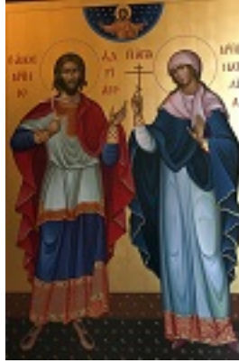
Άγιοι Ανδριανός και Ναταλία