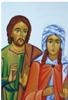
Άγιοι Ανδριανός και Ναταλία