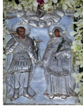
Άγιοι Ανδριανός και Ναταλία