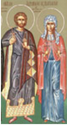
Άγιοι Ανδριανός και Ναταλία