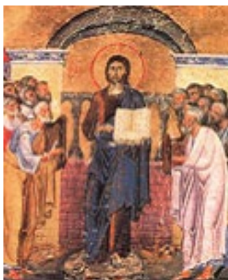
Αρχή της Ινδίκτου