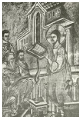
Αρχή της Ινδίκτου