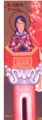
Όσιος Συμεών ο Στυλίτης