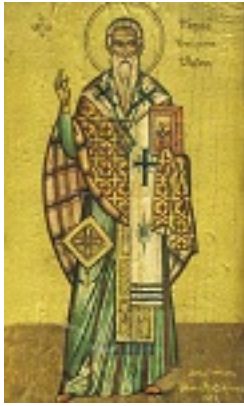
Άγιος Πέτρος ο Θαυματουργός Αρχιεπίσκοπος Άργους και Ναυπλίου - Είкона 1958 μ.Χ.