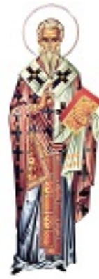
Άγιος Πέτρος ο Θαυματουργός Αρχιεπίσκοπος Άργους και Ναυπλίου