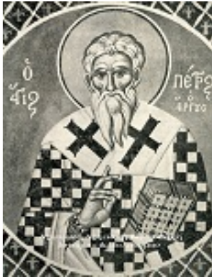
Άγιος Πέτρος ο Θαυματουργός Αρχιεπίσκοπος Άργους και Ναυπλίου - Φώτης Κόντογλου