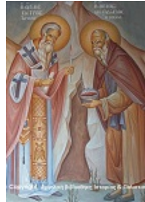
Άγιος Πέτρος Επίσκοπος Άργους και Όσιος Θεοδόσιος ο Νέος - Η Συνάντησις