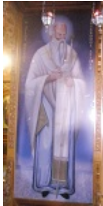
Άγιος Πέτρος ο Θαυματουργός Αρχιεπίσκοπος Άργους και Ναυπλίου (Ιερός Ναός Πέτρου Επισκόπου Άργους - Άργος)