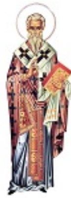
Άγιος Πέτρος ο Θαυματουργός Αρχιεπίσκοπος Άργους και Ναυπλίου