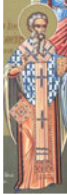
Άγιος Οικουμένιος ο Θαυματουργός επίσκοπος Τρίκκης