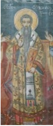
Άγιος Οικουμένιος ο Θαυματουργός επίσκοπος Τρίκκης