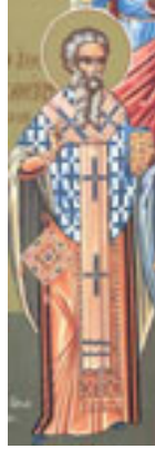
Άγιος Οικουμένιος ο Θαυματουργός επίσκοπος Τρίκκης