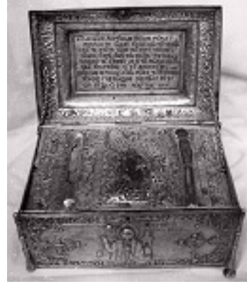
Θήκη με τα Ιερά Λείψανα του Αγίου Οικουμένιου του Θαυματουργού επισκόπου Τρίκκης