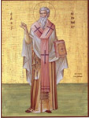
Άγιος Ειρηναίος Επίσκοπος Λουγδούνου