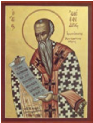
Άγιος Αλέξανδρος Πατριάρχης Κωνσταντινούπολης