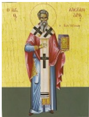
Άγιος Αλέξανδρος Πατριάρχης Κωνσταντινούπολης