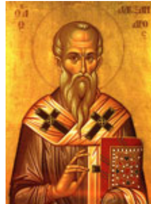
Άγιος Αλέξανδρος Πατριάρχης Κωνσταντινούπολης