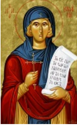
Οσία Βρυαΐνη - Μιχαήλ Χατζημιχαήλ©