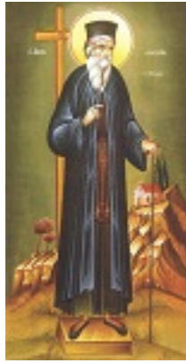
Άγιος Κοσμάς ο Αιτωλός