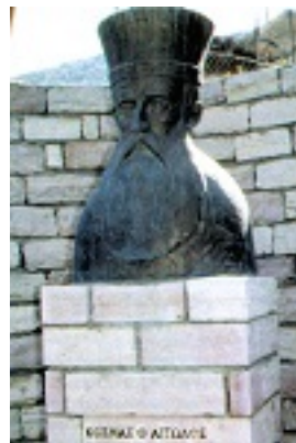
Προτομή του Αγίου Κοσμά του Αιτωλού στο Μέγα Δένδρο Αιτωλοακαρνανίας