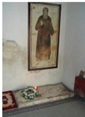
Ο τάφος του Αγίου Κοσμά του Αιτωλού στην Ιερά Μονή Εισοδίων της Θεοτόκου, Κολικόντασι Βορείου Ηπείρου