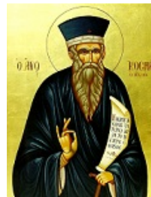
Άγιος Κοσμάς ο Αιτωλός