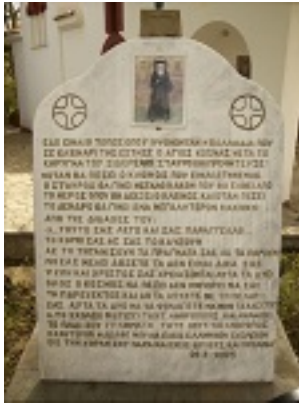
Άγιος Κοσμάς ο Αιτωλός