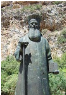
Άγιος Κοσμάς ο Αιτωλός