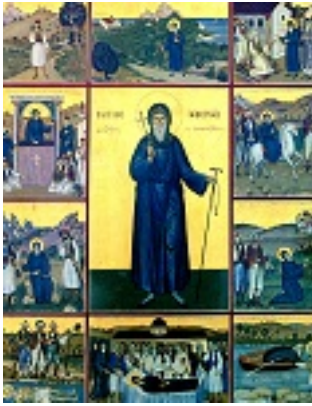
Εικόνα με στιγμιότυπα από την ζωή του Αγίου Κοσμά του Αιτωλού - Μέγα Δένδρο Αιτωλοακαρνανίας