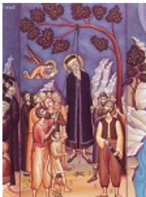
Το μαρτύριο του Αγίου Κοσμά του Αιτωλού