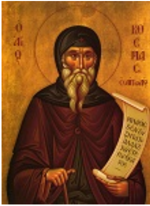
Άγιος Κοσμάς ο Αιτωλός