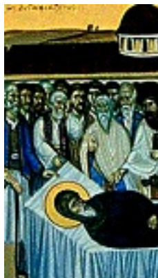
Η Κοίμησις του Αγίου Κοσμά του Αιτωλού