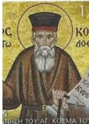
Άγιος Κοσμάς ο Αιτωλός