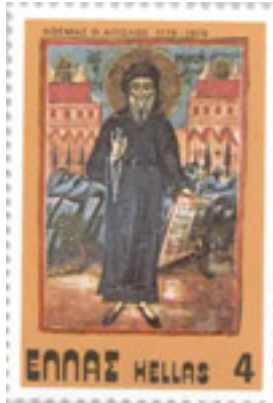
Άγιος Κοσμάς ο Αιτωλός