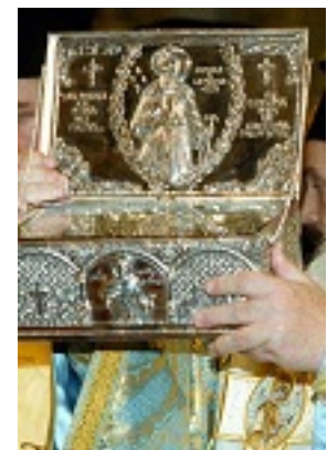
Άγιος Κοσμάς ο Αιτωλός