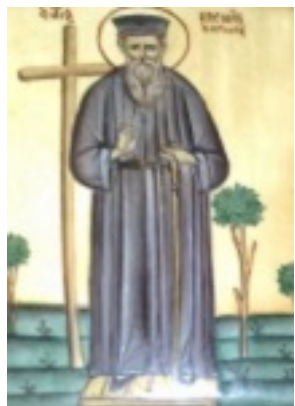
Άγιος Κοσμάς ο Αιτωλός