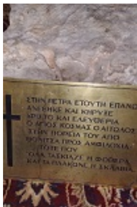
Πέτρα στην οποία πάτησε και κήρυξε ο Άγιος Κοσμάς ο Αιτωλός