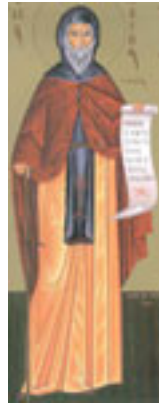
Άγιος Κοσμάς ο Αιτωλός