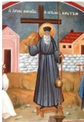
Ο Άγιος Κοσμάς κηρύττων - Τοιχογραφία στο μοναστήρι Μεταμόρφωσης του Σωτήρος, Δρυόβουνου Κοζάνης