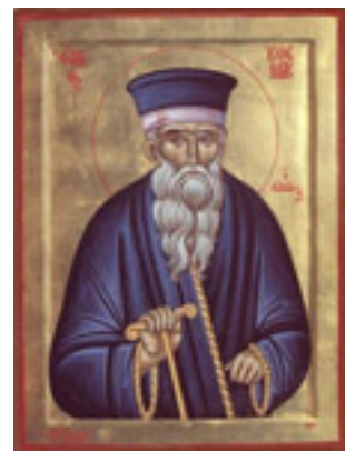
Άγιος Κοσμάς ο Αιτωλός