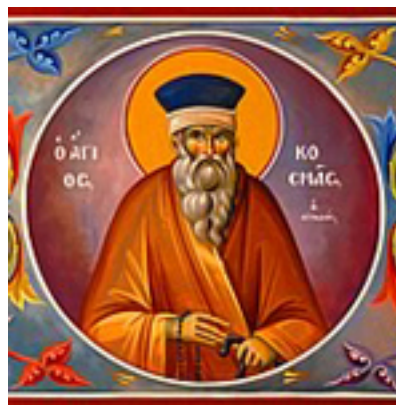
Άγιος Κοσμάς ο Αιτωλός - Γεώργιος Μαμάτσιος ( www.mamatsios.gr )