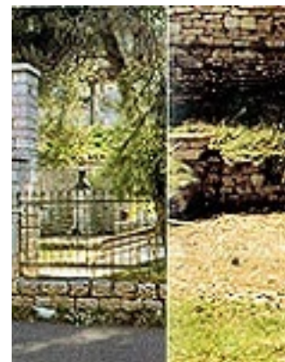
Τα θεμέλια από την οικία του Αγίου Κοσμά στο Μέγα Δένδρο του Αιτωλού