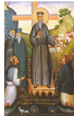
Ο Άγιος Κοσμάς κηρύττων