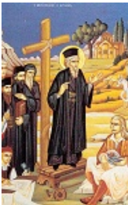
Ο Άγιος Κοσμάς κηρύττων