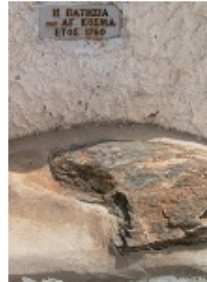
Η πέτρα στον Γέρμα, στην οποία πάτησε και κήρυξε ο Άγιος Κοσμάς ο Αιτωλός