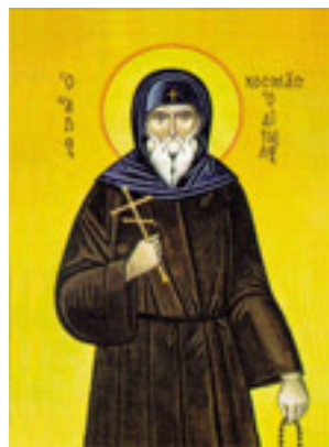
Άγιος Κοσμάς ο Αιτωλός