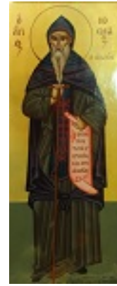
Άγιος Κοσμάς ο Αιτωλός