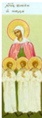
Αγία Βάσσα και τα παιδιά της Θεόγνιος, Αγάπιος και Πιστός