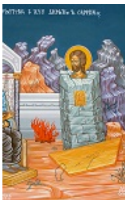
Άγιος Δημήτριος ο Μοναχός από τη Σαμαρίνα της Πίνδου (Ι. Ν. Αγ. Σπυρίδωνα Νεοχωρόπουλο Ιωαννίνων) - Π. Κούβαρη και Ι. Χ. Θωμάς© (icones.gr)