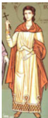
Άγιος Δημήτριος ο Μοναχός από τη Σαμαρίνα της Πίνδου