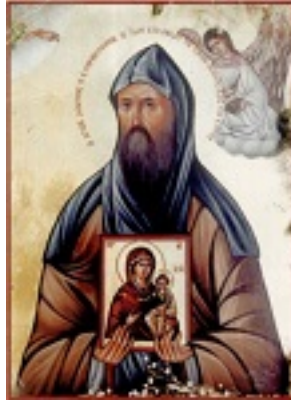
Όσιος Αλύπιος ο Εικονογράφος ο εν Σηλαίω