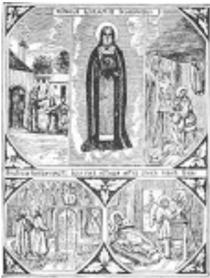
Όσιος Αλύπιος ο Εικονογράφος ο εν Σηλαίω