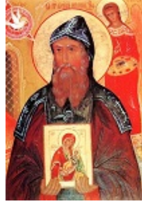
Όσιος Αλύπιος ο Εικονογράφος ο εν Σηλαίω