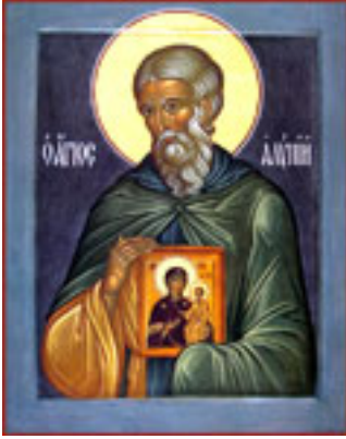
Όσιος Αλύπιος ο Εικονογράφος ο εν Σηλαίω