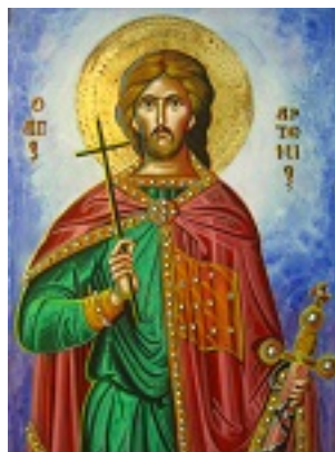
Άγιος Αρτέμιος ο Μεγαλομάρτυρας