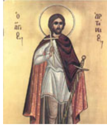
Άγιος Αρτέμιος ο Μεγαλομάρτυρας