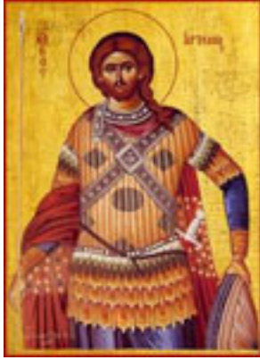
Άγιος Αρτέμιος ο Μεγαλομάρτυρας