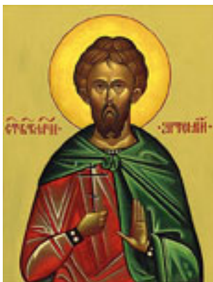
Άγιος Αρτέμιος ο Μεγαλομάρτυρας