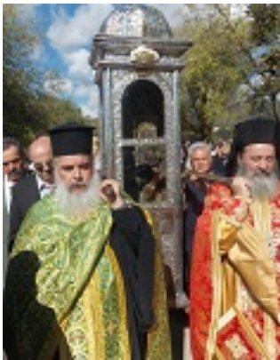
Το άφθαρτο σκήνωμα του Οσίου Γερασίμου του νέου ασκητή