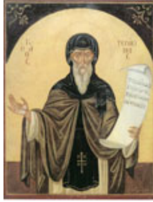
Όσιος Γεράσιμος ο νέος ασκητής