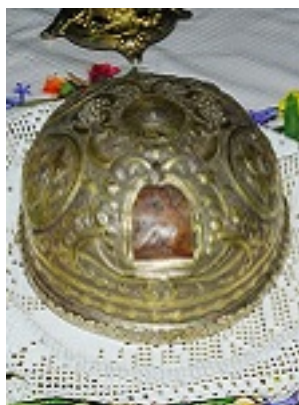
Η Τίμια Κάρα του Οσίου Δανιήλ του Μετεωρίτη