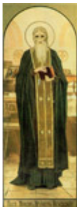
Όσιος Νίκων καθηγούμενος της Λαύρας των Σπηλαίων του Κιέβου