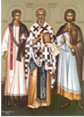
Άγιοι Λαυρέντιος αρχιδιάκονος, Ξύστος πάπας Ρώμης και Ιππόλυτος