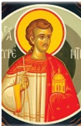
Άγιος Λαυρέντιος ο αρχιδιάκονος