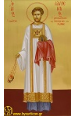
Άγιος Λαυρέντιος ο αρχιδιάκονος