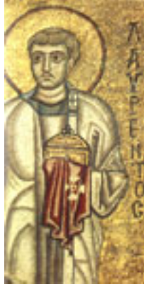
Άγιος Λαυρέντιος ο αρχιδιάκονος