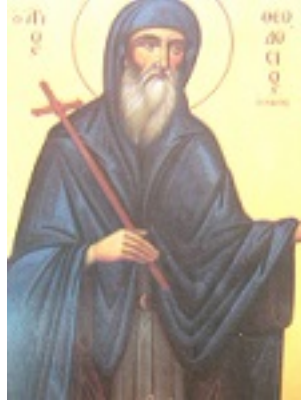
Όσιος Θεοδόσιος ο νέος, ο ιαματικός