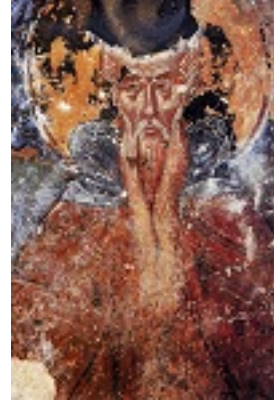
Όσιος Θεοδόσιος ο νέος, ο ιαματικός - Τοιχογραφία παλαιότερης περιόδου