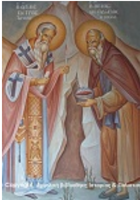
Άγιος Πέτρος Επίσκοπος Άργους και Όσιος Θεοδόσιος ο Νέος - Η Συνάντησις