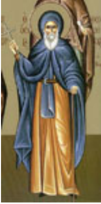
Όσιος Θεοδόσιος ο νέος, ο ιαματικός