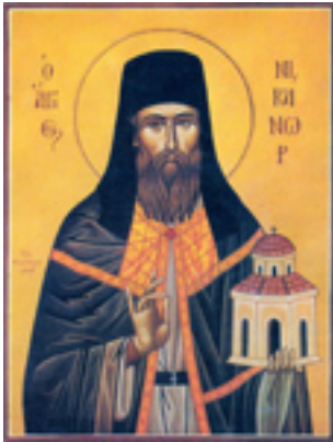
Όσιος Νικάνωρ θαυματουργός