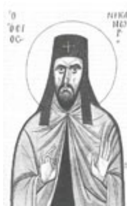
Όσιος Νικάνωρ θαυματουργός