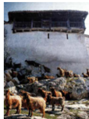
Άποψη της Ιεράς Μονής του Αγίου Νικάνωρ