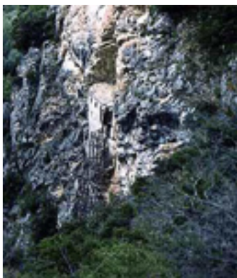
Άποψη της Ιεράς Μονής του Αγίου Νικάνωρ