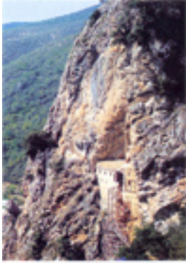
Εξωτερική όψη της Μονής του Αγίου Νικάνωρ στην Ερμούπολη (Μυκόνος)

Άποψη της Ιεράς<br />Μονής του Αγίου<br />Νικάνωρ