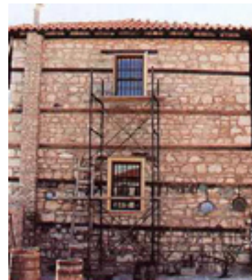
Άποψη της Ιεράς Μονής του Αγίου Νικάνωρ