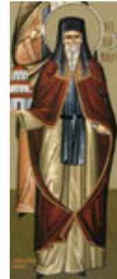
Όσιος Νικάνωρ θαυματουργός