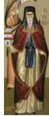
Όσιος Νικάνωρ θαυματουργός