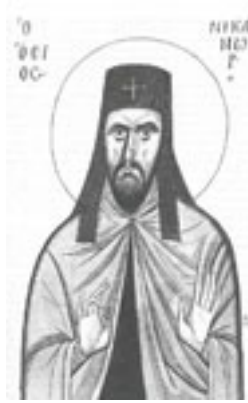
Όσιος Νικάνωρ θαυματουργός