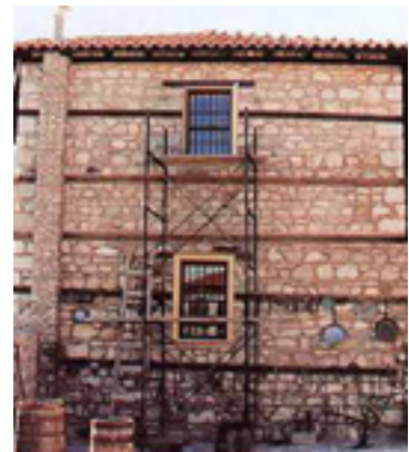
Άποψη της Ιεράς Μονής του Αγίου Νικάνωρ