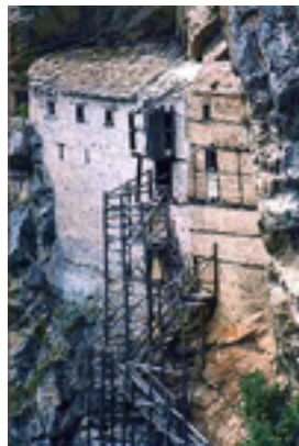
Άποψη της Ιεράς Μονής του Αγίου Νικάνωρ