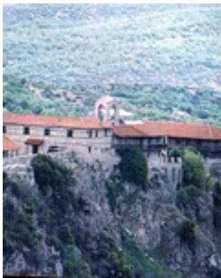
Άποψη της Ιεράς Μονής του Αγίου Νικάνωρ