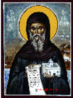
Όσιος Ιωσήφ ο Γεροντόγιαννης