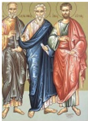
Άγιοι Σίλας, Σιλουανός και Κρήσκης οι Απόστολοι