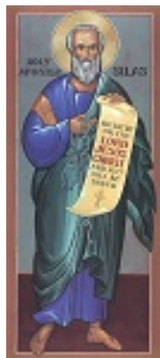
Άγιος Σίλας ο Απόστολος