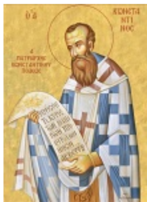
Άγιος Κωνσταντίνος, Πατριάρχης Κωνσταντινούπολης - Δια χειρός Νικ. Γαλανόπουλου – www.karadokis.gr