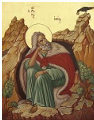
Προφήτης Ηλίας ο Θεσβίτης