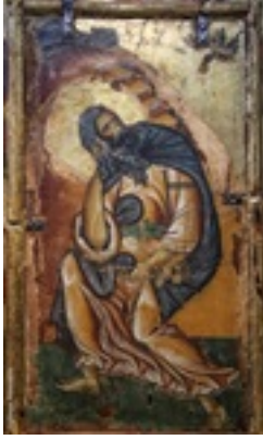
Προφήτης Ηλίας ο Θεσβίτης