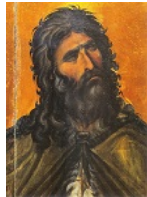
Προφήτης Ηλίας ο Θεσβίτης - Ιερά Μονή Σινά -13ος αι. μ.Χ.