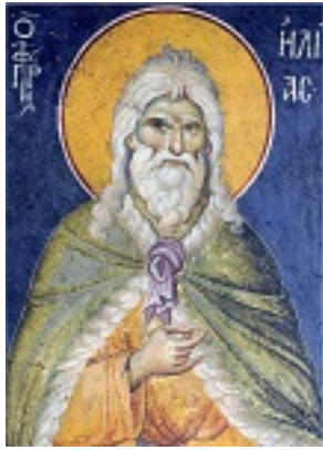
Προφήτης Ηλίας ο Θεσβίτης - Βυζαντινή τοιχογραφία στο Πρωτάτο των Καρυών στο Άγιο Όρος, φιλοτεχνημένη από τον Μανουήλ Πανσέληνος (περ. 1290)