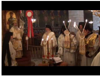
Ιεροσόλυμα-Λειτουργία στον Προφήτη Ηλία