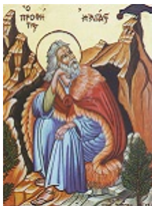
Προφήτης Ηλίας ο Θεσβίτης - Δια χειρός Ευαγ. Τσόλη