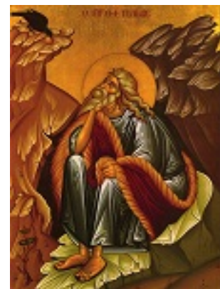
Προφήτης Ηλίας ο Θεσβίτης