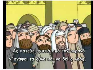
Ο προφήτης Ηλίας (για παιδιά)