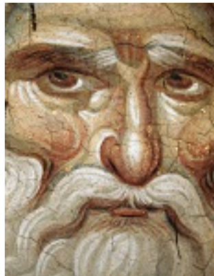
Προφήτης Ηλίας ο Θεσβίτης