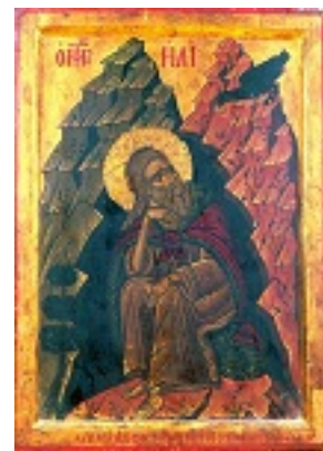
Προφήτης Ηλίας ο Θεσβίτης