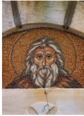
Προφήτης Ηλίας ο Θεσβίτης - Αγγελική Τσέλιου© ( diacheirosaggelikistseliou.blogspot.com )