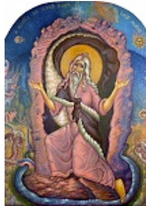
Η θεολογία του προφήτου Ηλιού εις το όρος Χωρίβ - π. Σταμάτης Σκλήρης© (stamatis-skliris.gr)