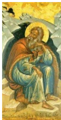
Προφήτης Ηλίας ο Θεσβίτης - δεύτερο μισό 16ου αι. μ.Χ. - Μονή Σταυρονικήτα, Άγιον Όρος (Κρητική Σχολή, Μιχαήλ Δαμασκηνός)