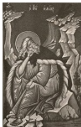
Προφήτης Ηλίας ο Θεσβίτης - Φώτης Κόντογλου