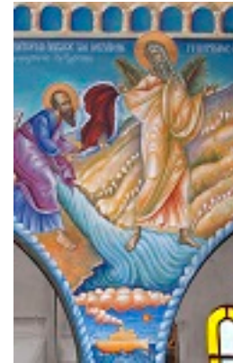
Προφήτης Ηλίας ο Θεσβίτης - π. Σταμάτης Σκλήρης© (stamatis-skliris.gr)