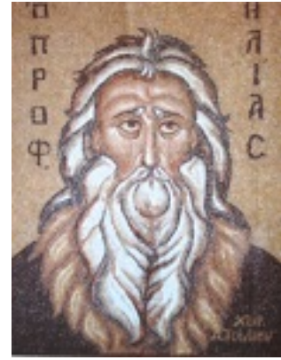
Προφήτης Ηλίας ο Θεσβίτης - Αγγελική Τσέλιου© ( diacheirosaggelikistseliou.blogspot.com )