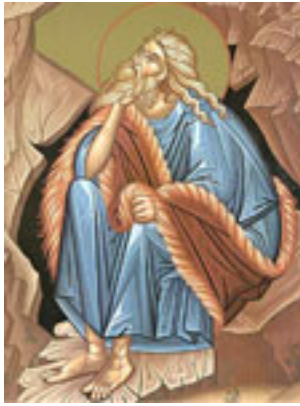
Προφήτης Ηλίας ο Θεσβίτης