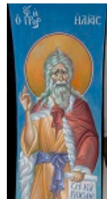
Προφήτης Ηλίας ο Θεσβίτης