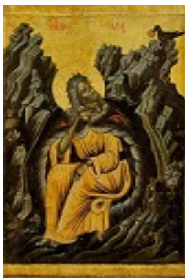
Προφήτης Ηλίας ο Θεσβίτης - μέσα 18ου αι. μ.Χ., Νέα Σκήτη, Άγιον Όρος