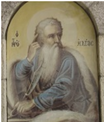
Προφήτης Ηλίας ο Θεσβίτης