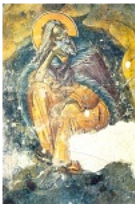
Προφήτης Ηλίας ο Θεσβίτης - Τοιχογραφία του 17ου αιώνα (Ι. Ν. Αγ. Γεωργίου Ακραφνίου)