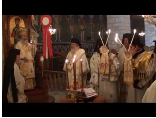
Ιεροσόλυμα-Λειτουργία στον Προφήτη Ηλία