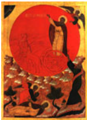
Προφήτης Ηλίας ο Θεσβίτης