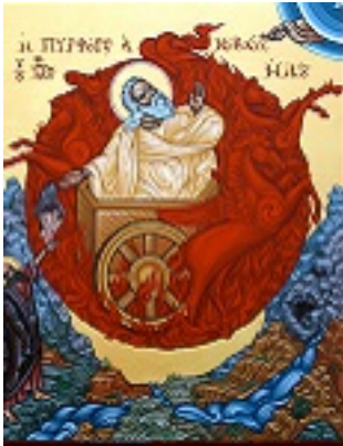
Προφήτης Ηλίας ο Θεσβίτης - Π. Κούβαρη και Ι. Χ. Θωμάς©