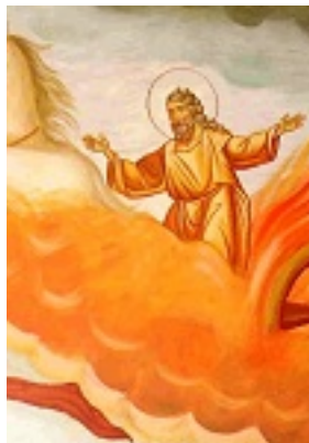
Προφήτης Ηλίας ο Θεσβίτης