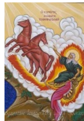
Η Πυρφόρος ανάβασις του Προφήτου Ηλιού - Λυδία Γουριώτη© ( http://lydiagouriotti-iconography.blogspot.com )