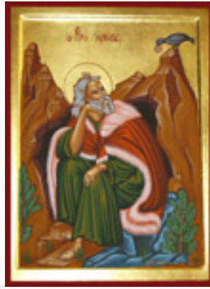
Προφήτης Ηλίας ο Θεσβίτης - Λυδία Γουριώτη© ( http://lydiagourioti- iconography.blogspot.com )