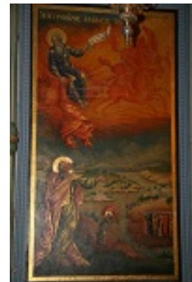
Η εικόνα του Προφήτου Ηλιού στο τέμπλο της Ι.Μ. Ηλιού στα Ιεροσόλυμα