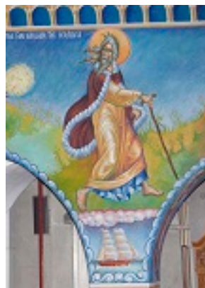
Ο Προφήτης Ηλίας φεύγει την κακίαν της Ιεζάβελ - π. Σταμάτης Σκλήρης© (stamatis-skliris.gr)