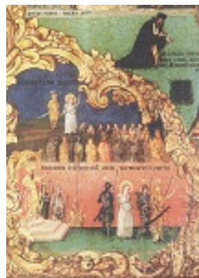
Σκηνές από το βίο και το μαρτύριο της Αγίας Μαρίνας