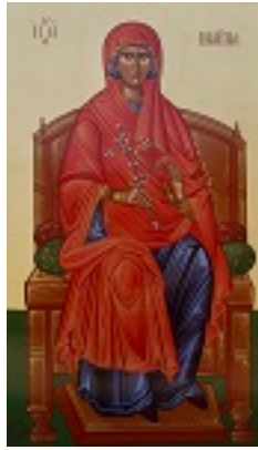
Αγία Μαρίνα - Μιχαήλ Χατζημιχαήλ©