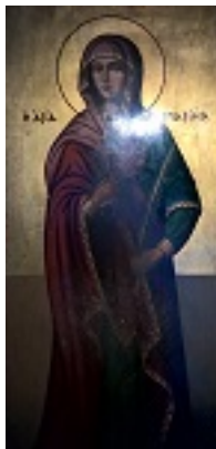
Αγία Μαρίνα - Ιερός Ναός Ευαγγελιστρίας Τήνου