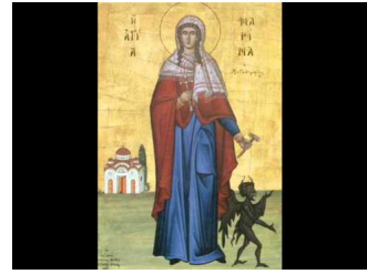
Η ΑΓΙΑ ΜΑΡΙΝΑ