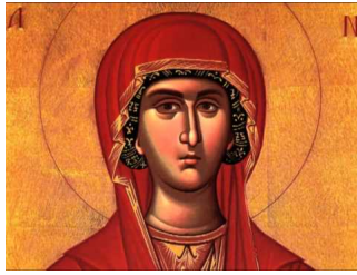
Ακούστε το απολυτίκιο!