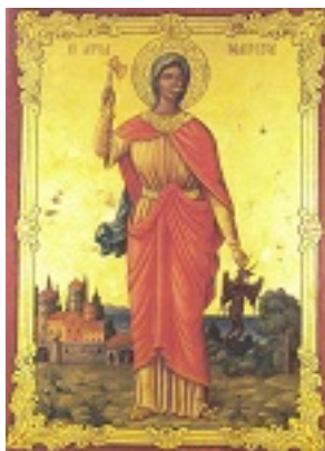
Η παλαιά εφέστια εικόνα της Αγίας Μαρίνας από τον ναόν του Θησείου χωρίς το σφυρήλατο, χρυσό κάλυμμα της