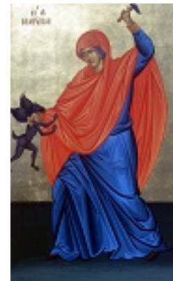
Αγία Μαρίνα - Μιχαήλ Χατζημιχαήλ©