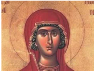
Ακούστε το απολυτίκιο!