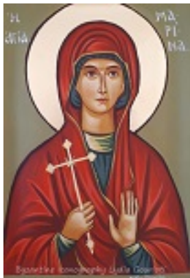
Αγία Μαρίνα - Λυδία Γουριώτη© ( http://lydiagourioti- iconography.blogspot.com )