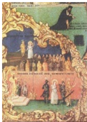
Σκηνές από το βίο και το μαρτύριο της Αγίας Μαρίνας