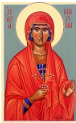
Αγία Μαρίνα - Μιχαήλ Χατζημιχαήλ©