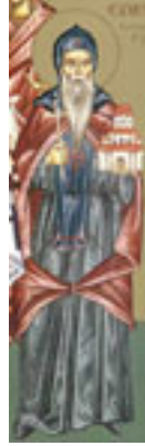
Όσιος Συμεών Κτήτορας της Μονής Χιλανδαρίου Αγίου Όρους