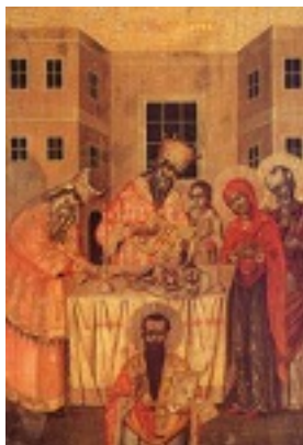
Η Περιτομή του Κυρίου και ο Άγιος Βασίλειος - Ι. Μ. Αγίου Παντελεήμονος (Ρωσικόν), Άγιο Όρος