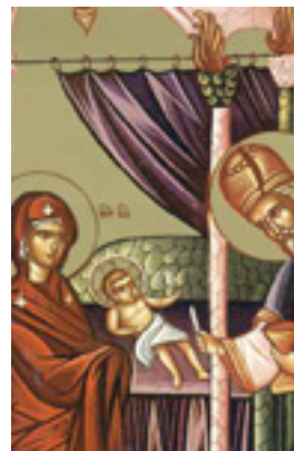
Περιτομή του Κυρίου