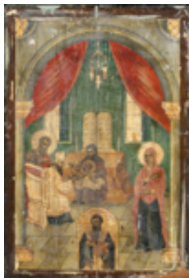
Η Περιτομή του Κυρίου και ο Άγιος Βασίλειος - Ι.Ν. Ζωοδόχου Πηγής, Λαρίσης ( http://www.panagialarisis.gr )