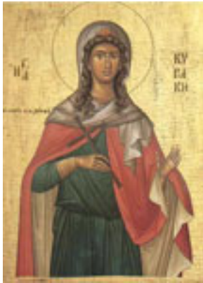
Αγία Κυριακή η Μεγαλομάρτυς