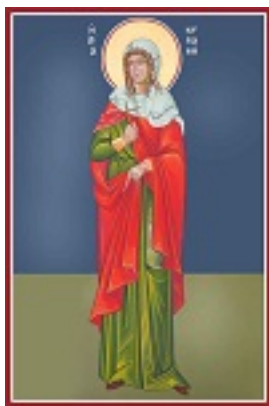
Αγία Κυριακή η Μεγαλομάρτυς - Καζακίδου Μαρία© (byzantineartkazakidou. blogspot.com)