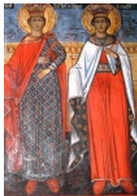
Η Αγία Βαρβάρα και η Αγία Κυριακή (Τοιχογραφία στη Λιθιά Καστοριάς, έτ. 1850 μ.Χ.)