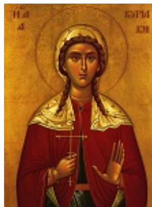
Αγία Κυριακή η Μεγαλομάρτυς