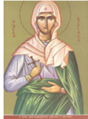
Αγία Κυριακή η Μεγαλομάρτυς