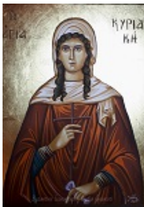
Αγία Κυριακή η Μεγαλομάρτυς - Λυδία Γουριιώτη© ( http://lydiagourioti- iconography.blogspot.com )