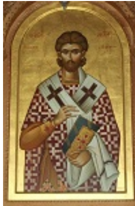
Άγιος Αστέριος επίσκοπος Δυρραχίου Άγιος Αστέριος επίσκοπος Δυρραχίου - Εικόνα στο Ναό του Ευαγγελισμού, Τίρανα