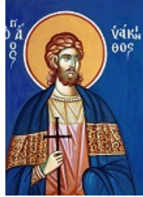
Άγιος Υάκινθος ο κουβικουλάριος