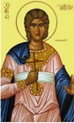
Άγιος Υάκινθος ο κουβικουλάριος