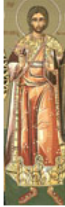
Άγιος Υάκινθος ο κουβικουλάριος