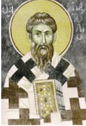
Άγιος Ανατόλιος Πατριάρχης Κωνσταντινούπολης