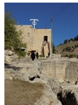
Το σπήλαιο - τάφος του Αγίου Ιουβενάλιου Πατριάρχου Ιεροσολύμων στα Ιεροσόλυμα, εντός της Μονής του Αγίου Ονουφρίου στην περιοχή του Σιλωάμ