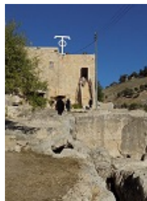
Το σπήλαιο - τάφος του Αγίου Ιουβενάλιου Πατριάρχου Ιεροσολύμων στα Ιεροσόλυμα, εντός της Μονής του Αγίου Ονουφρίου στην περιοχή του Σιλωάμ