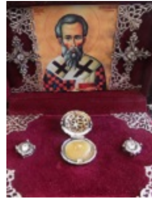
Ελάχιστο, μικρό τμήμα, ιερό τεμάχιο λειψάνου του Αγίου Ιουβενάλιου Πατριάρχου Ιεροσολύμων