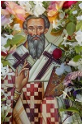
Άγιος Ιουβενάλιος Πατριάρχης Ιεροσολύμων