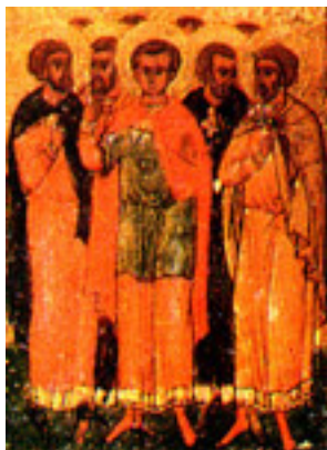
Άγιος Αγάπιος και των συν αυτώ μάρτυρες: Πλήσιος, Ρωμύλος, Τιμόλαος, Αλέξανδρος, Αλέξανδρος (έτερος), Διονύσιος καί Διονύσιος (έτερος)