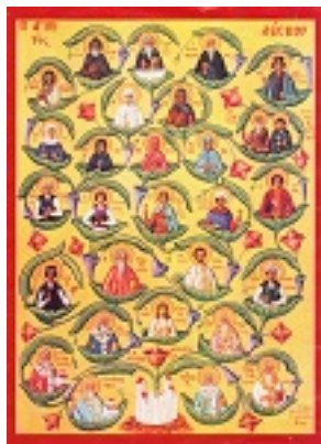
Σύναξη Πάντων των εν Λέσβω Αγίων