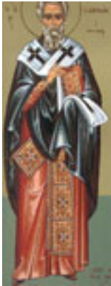
Άγιος Σαμψών ο Ξενοδόχος