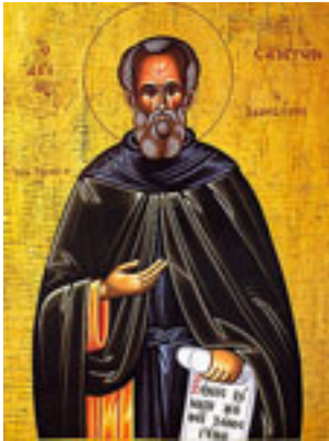
Άγιος Σαμψών ο Ξενοδόχος