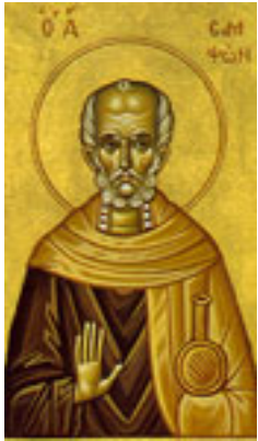
Άγιος Σαμψών ο Ξενοδόχος