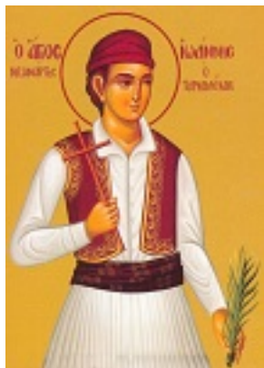
Άγιος Ιωάννης ο Τουρκολέκας