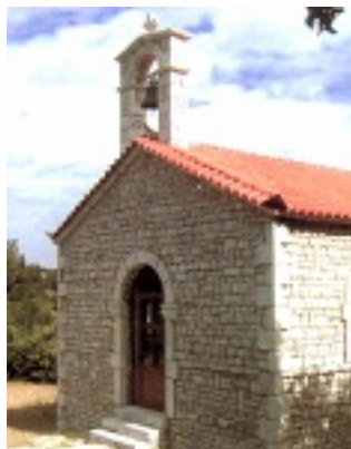
Ο Ιερός Ναός του Αγίου Ιωάννη του Τουρκολέκα