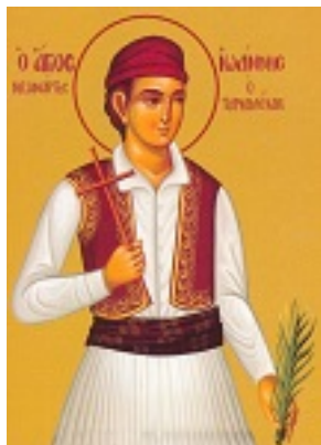
Άγιος Ιωάννης ο Τουρκολέκας