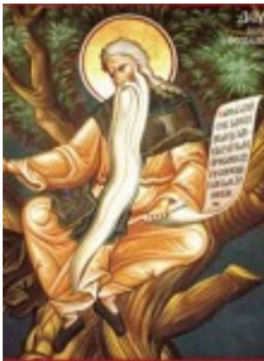
Όσιος Δαβίδ από τη Θεσσαλονίκη