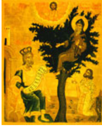
Όσιος Δαβίδ από τη Θεσσαλονίκη