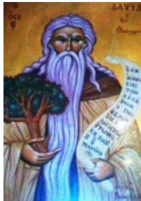
Όσιος Δαβίδ από τη Θεσσαλονίκη