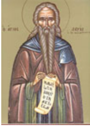
Όσιος Δαβίδ από τη Θεσσαλονίκη