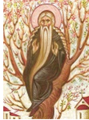
Όσιος Δαβίδ από τη Θεσσαλονίκη