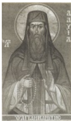
Σύγχρονη τοιχογραφία του οσιομάρτυρος Δαβίδ στην Μονή Ξηροποτάμου